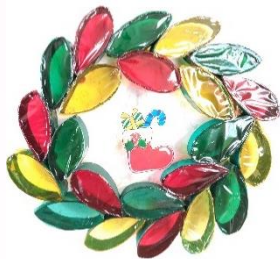
「クリスマスのリース」