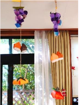
吊るし飾り「秋の味覚」